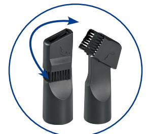
2-fach Zubehör: kombinierte Bürsten-/ Fugendüse